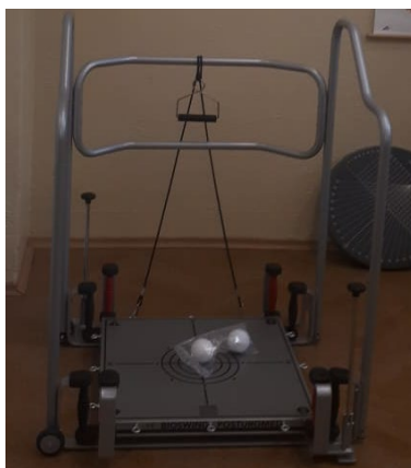
Obr.: Posturomed 202.

Posturomed 202 je liečebný prístroj, ktorý sa skladá z nestabilnej štvorcovej nášľapnej plochy s dvoma brzdami a z rámu, ktorého sa pacient môže pridržať pri strate stability. Ako náhle pacient vstúpi na labilnú plochu Posturomedu, plocha sa vychýľuje tým viac, čím je postoj pacienta nestabilnejší. Labilita nášľapnej plochy sa reguluje brzdými systémami. Dosiachnutie kvalitnej koordinácie všetkých svalových skupín, ktoré zaisťujú stabilitu v stoji a balanciu. Následne sa zlepšuje stabilita kĺbov, funkčné poruchy držania tela. Zlepšujú sa aj stavy po operáciách kĺbov a chrbtice, ktoré sú sprevádzané funkčnou nestabilitou.