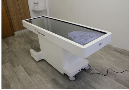
Obr.: Anatomage multifunkčný anatomický stôl.

Balančná a stabilometrická plošina: BIODEX BALANCE SYSTEM™ SD slúži na posúdenie rovnovážnej schopnosti končatín a trupu, poskytnutie spätnej väzby, možnosť použitia pre mono i bipedálnu terapiu. Toto zariadenie umožňuje cvičenie v uzavretom kinematickom reťazci, pracuje s rozložením telesnej váhy voči dolným končatinám a pridáva objektívne posúdenie rovnováhy pre posúdenie rizika pádu. BALANCE SYSTEM SD využíva snímače pod svojou platformou k detekcii fungovania posturálnych pohybov. Platforma môže byť zafixovaná proti balančným pohybom ( statický režim ) alebo uvoľnená pre balančné cvičenie s náklonom ( dynamický režim). Nameraný posturálny pohyb je zobrazený na displeji prístroja. Systém zhromažďuje, ukladá jednotlivé parametre a hodnoty, ktoré je následne možné vytlačiť. FZV je jediné pracovisko na Slovensku, ktoré vlastní toto zdravotnícke zariadenie.