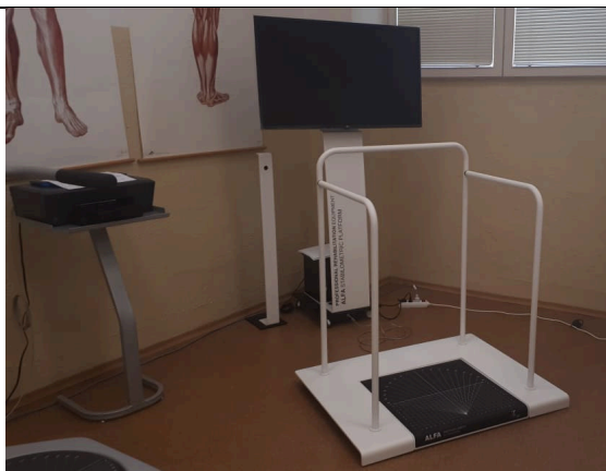
Obr: Stabilometrická platforma „ALFA“.

Posturomed 202 je liečebný prístroj, ktorý sa skladá z nestabilnej štvorcovej nášľapnej plochy s dvoma brzdami a z rámu, ktorého sa pacient môže pridržať pri strate stability. Ako náhle pacient vstúpi na labilnú plochu Posturomedu, plocha sa vychýľuje tým viac, čím je postoj pacienta nestabilnejší. Labilita nášľapnej plochy sa reguluje brzdými systémami. Dosiachnutie kvalitnej koordinácie všetkých svalových skupín, ktoré zaisťujú stabilitu v stoji a balanciu. Následne sa zlepšuje stabilita kĺbov, funkčné poruchy držania tela. Zlepšujú sa aj stavy po operáciách kĺbov a chrbtice, ktoré sú sprevádzané funkčnou nestabilitou.