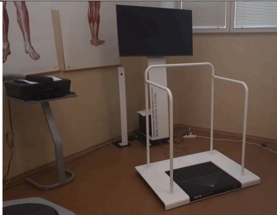
Obr: Stabilometrická platforma „ALFA“.

Posturomed 202 je liečebný prístroj, ktorý sa skladá z nestabilnej štvorcovej nášľapnej plochy s dvoma brzdami a z rámu, ktorého sa pacient môže pridržať pri strate stability. Ako náhle pacient vstúpi na labilnú plochu Posturomedu, plocha sa vychýľuje tým viac, čím je postoj pacienta nestabilnejší. Labilita nášľapnej plochy sa reguluje brzdými systémami. Dosiachnutie kvalitnej koordinácie všetkých svalových skupín, ktoré zaisťujú stabilitu v stoji a balanciu. Následne sa zlepšuje stabilita kĺbov, funkčné poruchy držania tela. Zlepšujú sa aj stavy po operáciách kĺbov a chrbtice, ktoré sú sprevádzané funkčnou nestabilitou.