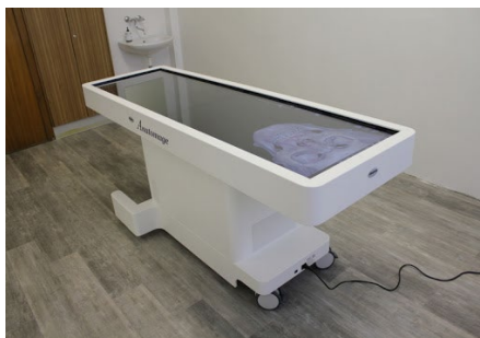
Obr.: Anatomage multifunkčný anatomický stôl.

Anatmage je multifunkčný anatomický stôl, ktorý v 3D projekcii umožňuje verné anatomické zobrazenie ľudského tela študentom. Tento anatomický stôl významne prispieva ku skvalitneniu výučby v rámci anatómie, fyziológie a patofyziológie.