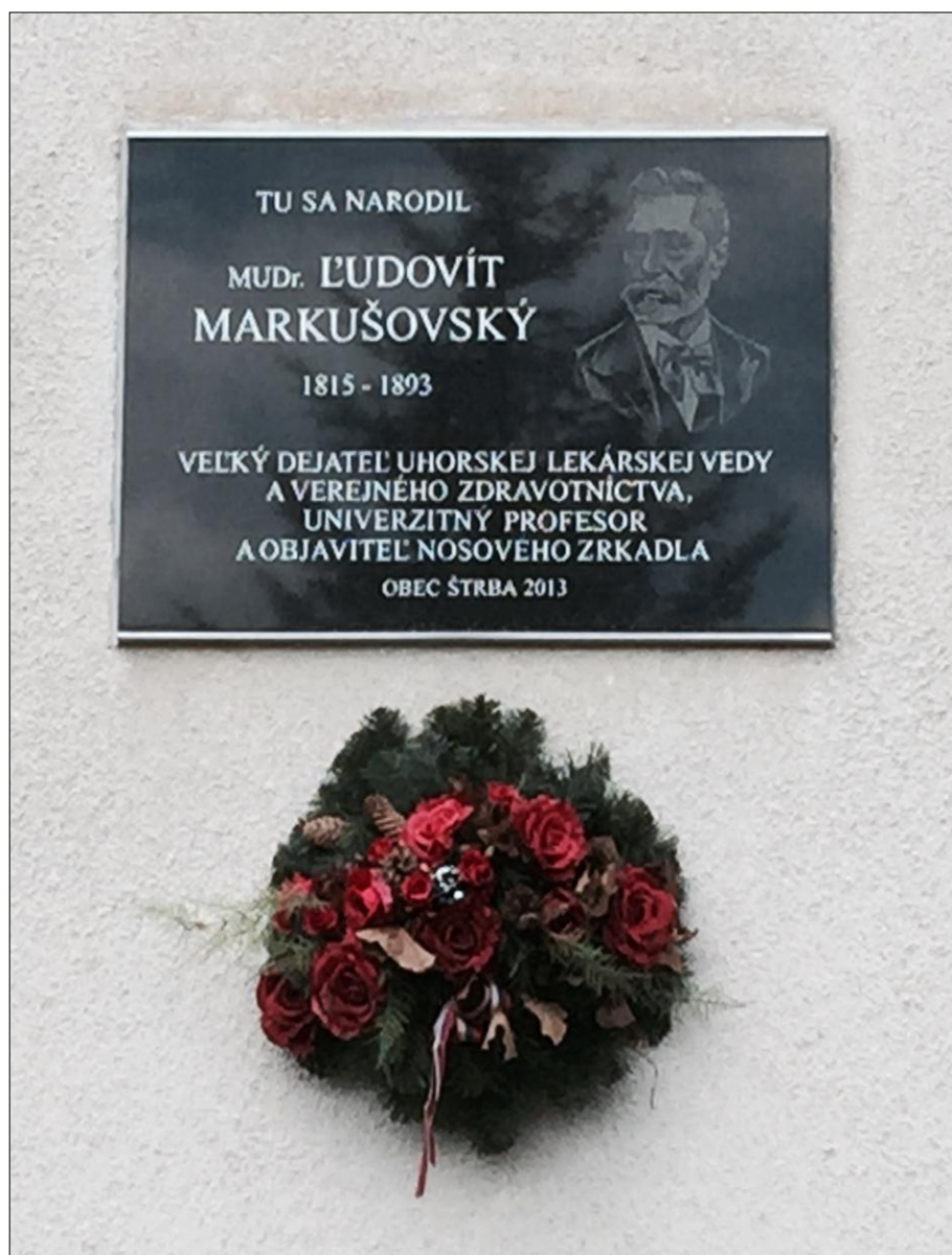
5. obrázok pamätná tabuľa