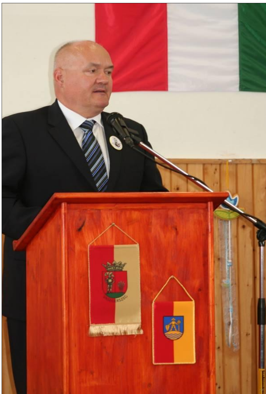
10. obrázok minister Hende Csaba